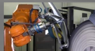
Produits Fonderie Aluminium