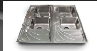
Éviers Acier Inoxydable