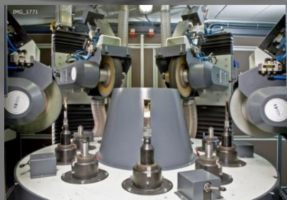
Machines rotatives CNC