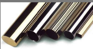
Tubes Acier Inoxydable